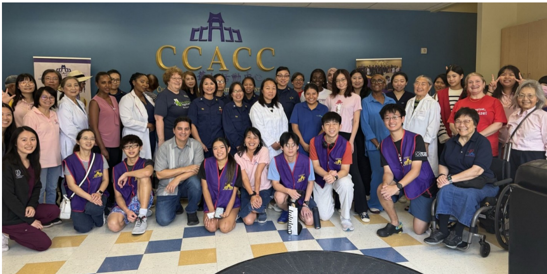
美京医疗中心2024健康博览会全体参展工作人员,包括美京医疗中心同仁以及志愿者合影。