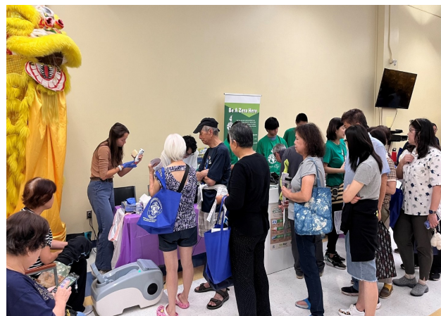
前来参与活动的居民络绎不绝。