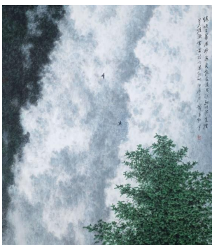
宣纸水墨水彩画《瀑流一二四》,作者靳杰强。