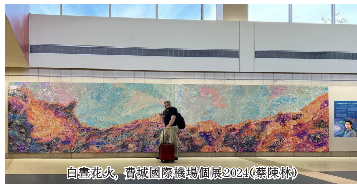
白晝花火，費城國際機場個展2024(蔡陳林)