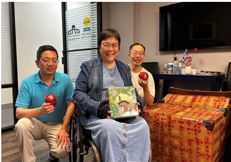
华府华美博物馆(CAMDC)特地从上海运来享誉盛名的龙华素斋苏式月饼。