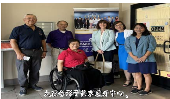
大家合影于美京医疗中心。