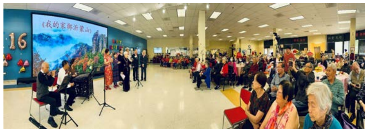
庆典现场高朋满座。