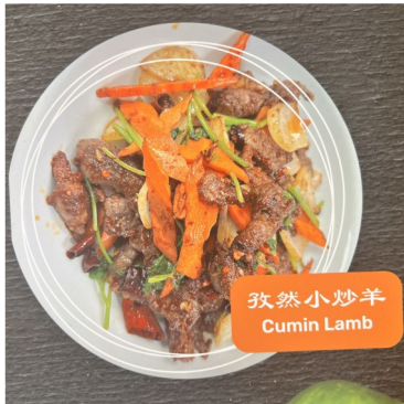
孜然小炒羊 Cumin Lamb