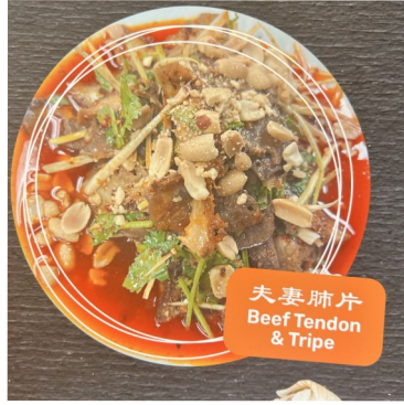
夫妻肺片 Beef Tendon & Tripe