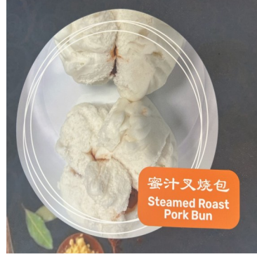
蜜汁叉烧包 Steamed Roast Pork Bun