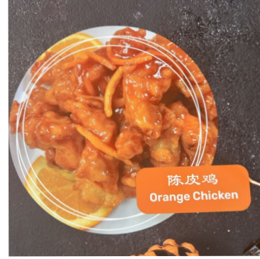
陈皮鸡 Orange Chicken