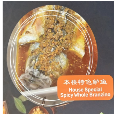
本楼特色鲈鱼 House Special Spicy Whole Branzino