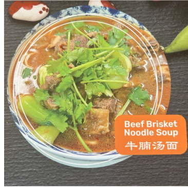
Beef Brisket Noodle Soup 牛腩汤面