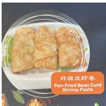
炸腐皮虾卷 Pan-Fried Bean Curd Shrimp Paste