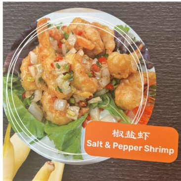
椒盐虾 Salt & Pepper Shrimp