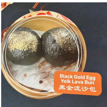
Black Gold Egg Yolk Lava Bun 黑金流沙包

地址:20-A Maryland Ave, Rockville, MD 20850