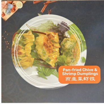
Pan-fried Chive & Shrimp Dumplings 煎韭菜虾仁饺