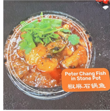
Peter Chang Fish in Stone Pot 椒麻石锅鱼