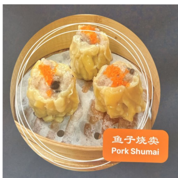
鱼子烧卖 Pork Shumai