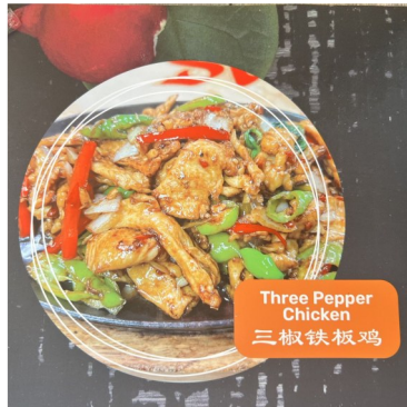
Three Pepper Chicken 三椒铁板鸡