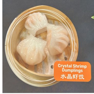
Crystal Shrimp Dumplings 水晶虾饺