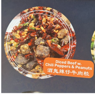
Diced Beef w. Chili Peppers & Peanuts 酒鬼辣仔牛肉粒