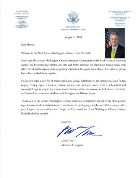
美国国会议员 David Trone 的贺信

光阴荏苒，跳动的音符，流溢的灯光，精彩的故事，厚重的历史，美丽的爱情，动听的旋律，摇曳的舞姿，一场极致的视听盛宴，带着独有的中国符号，将在这里，在美国首都华盛顿国会山前，与当代潮流奇妙碰撞。中华文明源远流长、博大精深，是中华民族的精神标识，是维系全世界华人的精神纽带。众所期待的第22届华盛顿中国文化节将于2024年8月31日上午10点在美国首都DC华丽揭幕。作为美国首都华盛顿地区首届一指展现中华传统文化的大型活动，本次文化节由美中工商联合会、美国大华府地区中国大专院校校友联合会、哈佛中文学校、华盛顿华人社区联盟、美中经济文化交流协会、美中实验学校、美国华人专业团体联合会、希望中文学校、华盛顿地区同乡会联合会共同主办，Yelp美食平台和大华府地区华人华侨社团共同参与协办，由东方卫视全程直播。