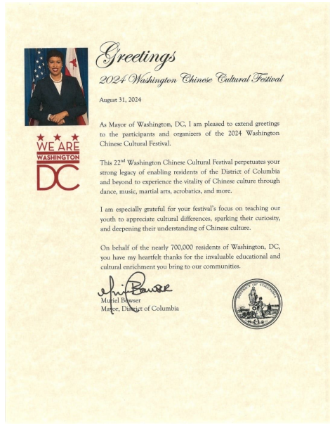
华盛顿哥伦比亚特区市长 Mayor Muriel Bowser 的贺信