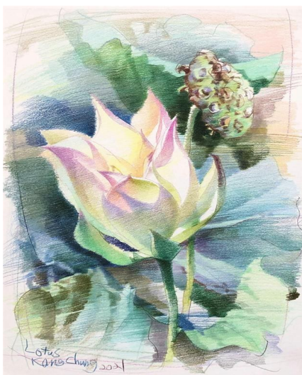
彩铅画《莲花》,作者钟耕略先生。