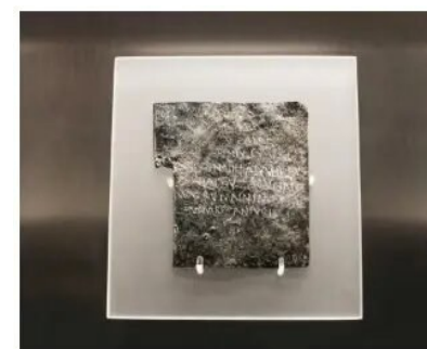
罗马诅咒片 (Roman curse tablets)