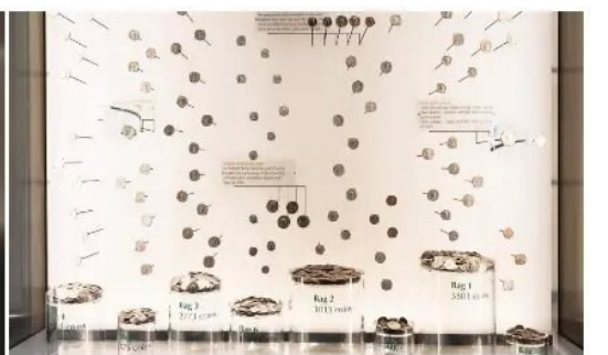
博街宝窟 (Beau Street Hoard)