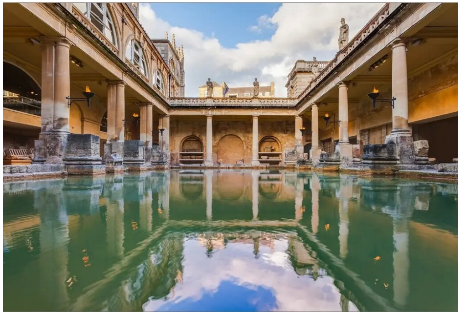
给您独一无二的美好体验!

任时光荏苒,泵房餐厅始终是巴斯闪亮的名片。它不仅是「下午茶自由」的聚集地,更传承着当地深厚的文化底蕴。这一场历史与美食的碰撞,注定在特殊的节日里,带