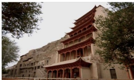
七律 故国游 (平水韵) 雨子诗 新海书

绿原草地阔无疆，翻卷银涛裹白羊。 城镇宽街商铺密，乡间窄路稻花香。 高楼矮舍均清静，流水浮桥却闹忙。 有幸暮年游塞外，惊魂跪拜是敦煌！