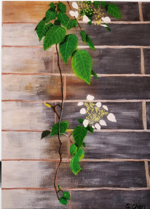
油画《月光清浅仲夏梦》 陈雯(雨文)

淡抹浅描，月夜森林夏梦。 如醉似迷，坝簾瑟曲三弄。 挥洒文章，毋循俗念凡音，且把情思哦诵。