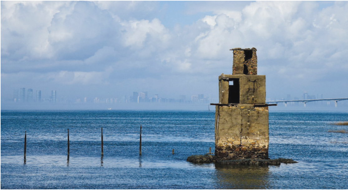
在金门县金城镇浯江溪入海口附近一处海滩眺望,可见远处厦门的高楼群。