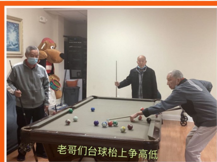
老哥们台球台上争高低