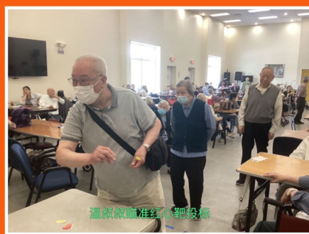
温叔叔瞄准红心靶投球