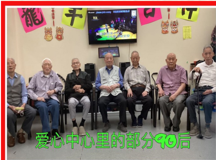
爱心中心里的部分90后