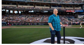
3千万本畅销书“标杆人生”的作者华理克牧师 Rev. Rick Warren