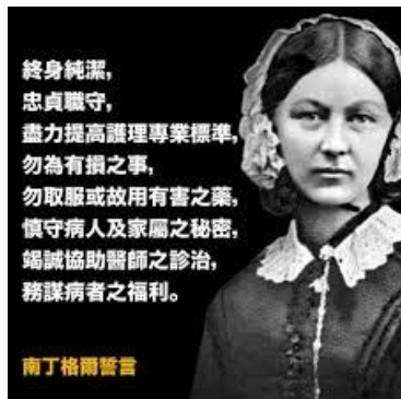
改变护理学的女伟人

佛罗伦斯·南丁格尔(Florence Nightingale, 1820-1910)是现代护理学的创始人。她大幅提升了护士的专业与价值,为了纪念她,世人把她的生日5月12日定为「国际护士节」。