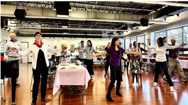
一整天的会议后，大家共跳“科目三”同乐。