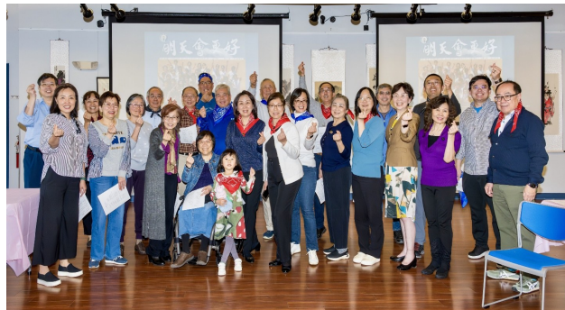
CCACC董事会成员及其家属与行政团队合影留念。