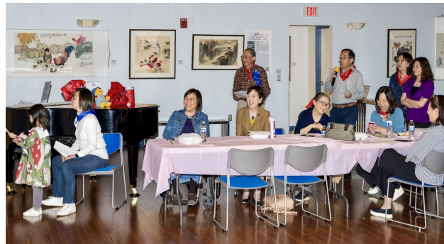
大家沉浸在欢乐的节目表演中。

美京华人活动中心 (CCACC) 一年四季秉持着仁爱、诚信、和乐的核心价值,务实的为社区民众提供全方位贴心服务,并每年四月举办进修会 (Retreat),以省内进修,综观大环境,策划未来,凝聚团队精神。本年度进修会参与的董事、高层主管以及资深顾问有二十余人。