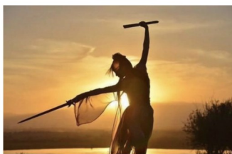
七律 凌云志 (平水韵, 新韵) 雨子诗 新海书

诵读聆听尽晚归， 新诗古韵伴朝晖。 春时日暖吟春色， 夏夜风柔润夏菲。 璧玉冰心自为佩， 珠玑佳句漫成辉。 他年更作惊人语， 送入青云与翠微。