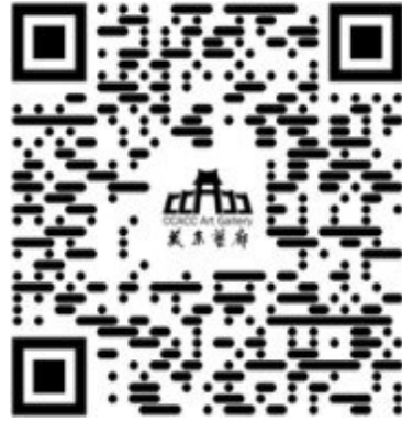
中文捐赠网页二维码