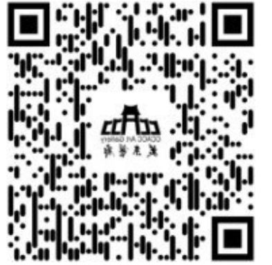
英文捐赠网页二维码