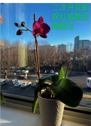
二次开花的粉红偏紫色蝴蝶兰