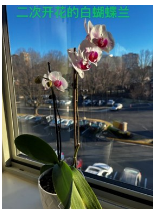
二次开花的白蝴蝶兰