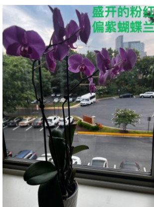
盛开的粉红偏紫蝴蝶兰