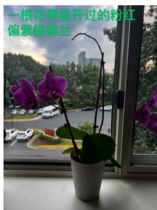
一根花梗盛开过的粉红偏紫蝴蝶兰

通过这些小招，成功地使蝴蝶兰再次开花。之所以记录上述的过程，是希望与蝴蝶兰爱好的朋友进行经验交流，让蝴蝶兰在各自家庭里二度绽放出美丽的花朵。也有人告诉我，侍弄得好，蝴蝶兰还可以第三次开花。我也打算试试。