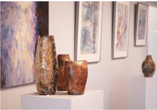
美京艺廊的展览尽显典雅。