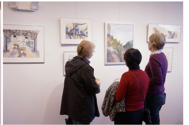
中外人士共同品评画作。