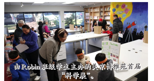
由Robin班级学生主办的美京博雅苑首届“科学展”。