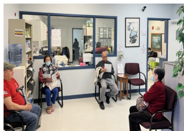
不同族裔的社区居民前来就诊。