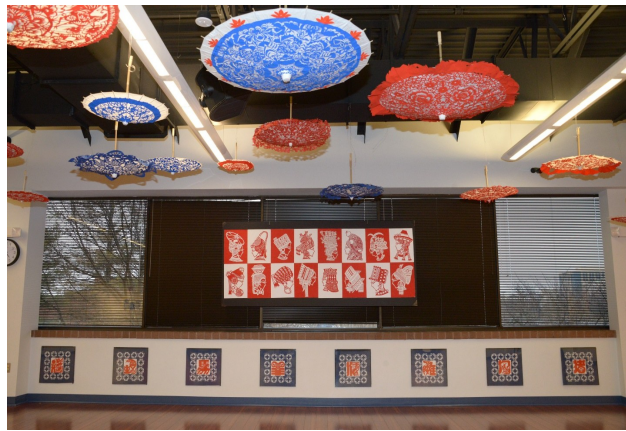
曾展出于美京艺廊的中华剪贴艺术。