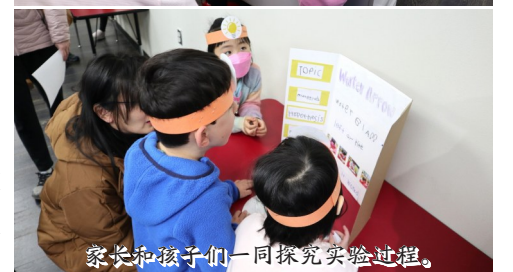
家长和孩子一同探究实验过程。