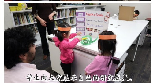
学生向大家展示自己的研究成果。