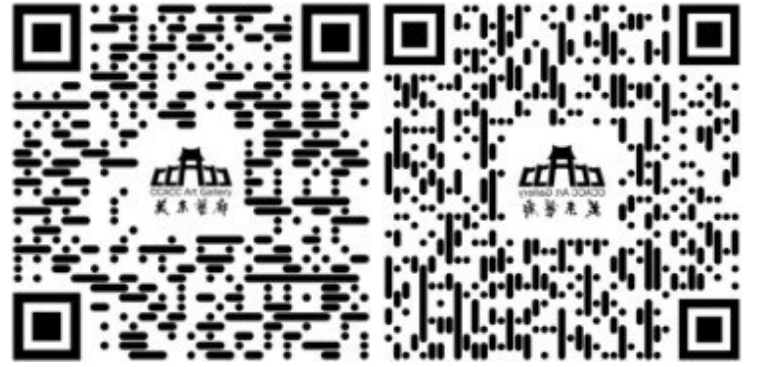
中文捐赠网页二维码