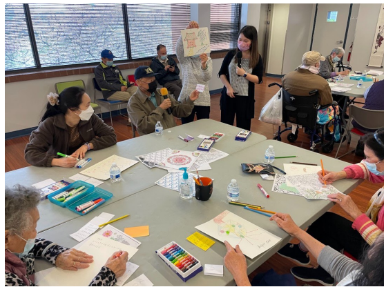
参与者们分享“点、线、面”艺术疗愈及诗词创作。

艺术疗愈与心理健康工作坊共有六场,每月一场,下一场定于4月27日(星期六)上午在美京艺廊举办。美京艺廊衷心感谢所有参与者的积极参与和热情反馈,并热切欢迎更多社区居民踊跃报名参加!(撰文—美京艺廊)