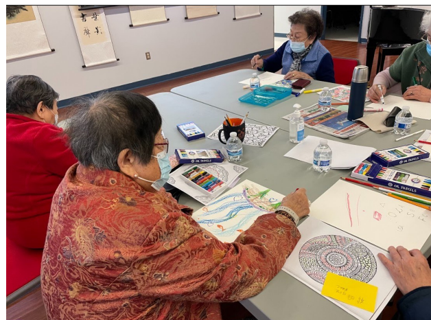
参与者们积极创作本次艺术疗愈主题活动。