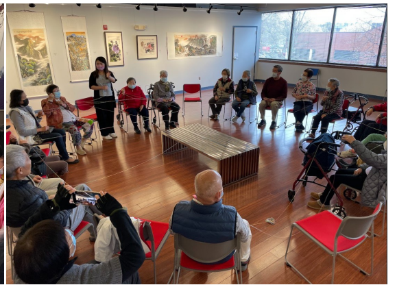
同心网团体毛线活动。