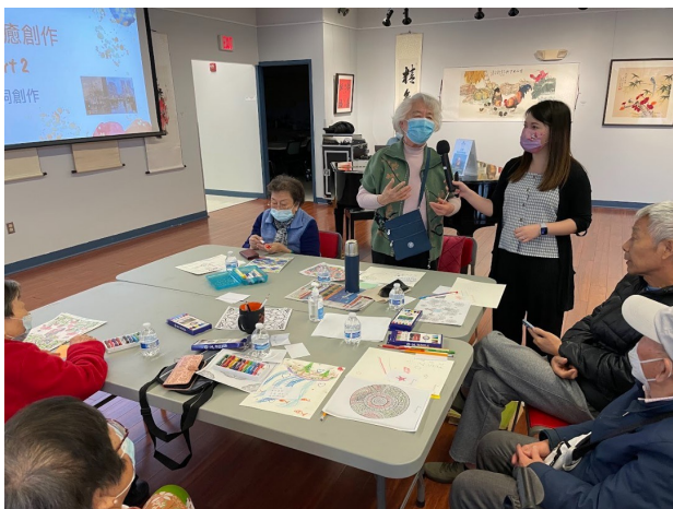
参与者分享创作心得和启发。