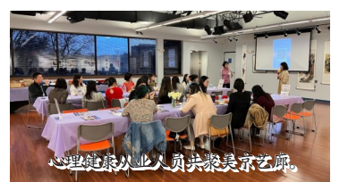
心理健康从业人员共聚美京艺廊。