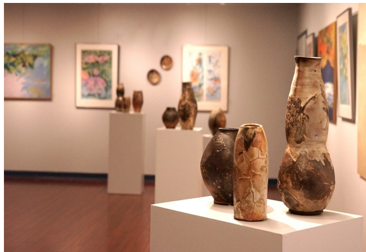
艺廊各处尽显典雅。

美京艺廊是美京华人活动中心以提升文化和服务社区大众为使命的艺术交流场所。艺廊没有收入来源,自2016年以来举办数百场展览和文艺活动,全部是无偿提供给大众,艺廊的所有项目也都是由义工筹划完成。我们现计划采购一款尖端技术高解析度移动LED视频墙、一套音响设备及两台互动式触摸屏资讯亭(其中一台专为长者或行动不便访者使用),以改进我们展示和诠释绘画艺术作