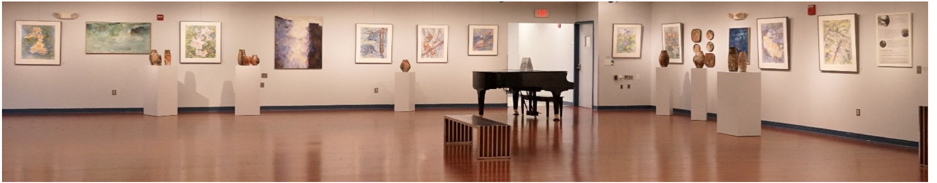
美京艺廊精心布置的展览现场。