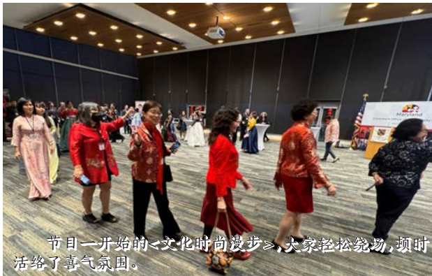
节目一开始的《文化时尚漫步》,大家轻松绕场,顿时活跃了喜气氛围。