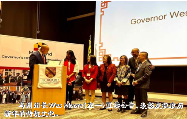
马州州长Wes Moore(左一)宣读公告,表彰庆祝农历新年的传统文化。