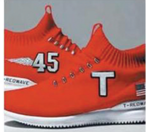
T - Red Wave $199