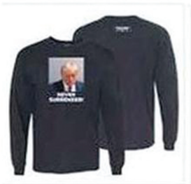
Never Surrender Black Long Sleeve T-Shirt $34.00