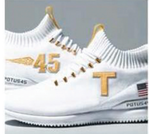
POTUS 45 $199