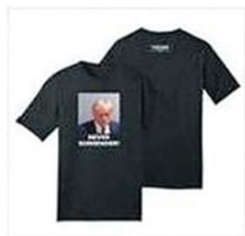
Never Surrender Black Premium Cotton T-Shirt $34.00