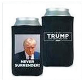
Never Surrender Beverage Cooler (Set of 2) - Black $15.00