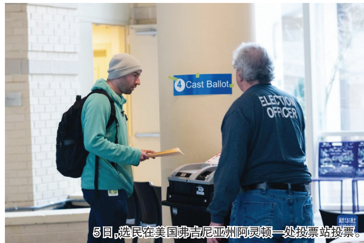
5日，选民在美国弗吉尼亚州阿灵顿一处投票站投票。

对于可能重现的选举对决，拜登与特朗普究竟谁能走到最后？接下来，又是否有可能飞出“黑天鹅”，搅动大选选情？局势仍待观察。