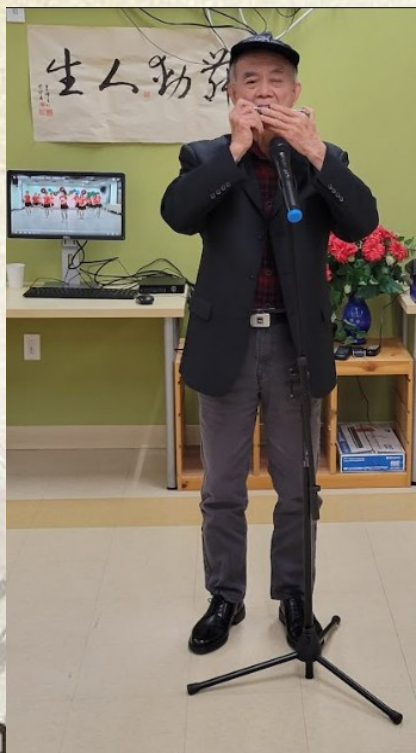
明长贵伯父口琴表演「北国之春」、「茉莉花」