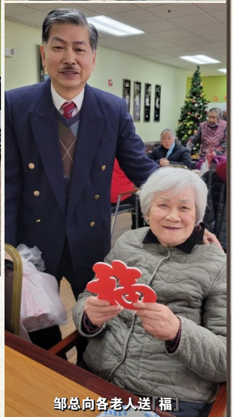
邹总向各老人送「福」