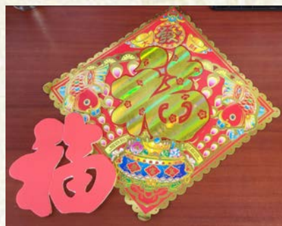
双「福」临门, 殷伯父亲手刻上「福」字,送给大家