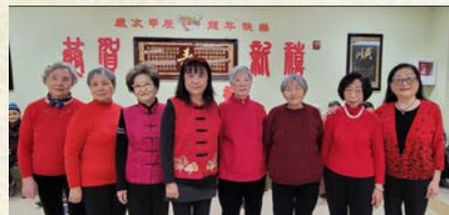
排舞成员表演「迎春花」

为什么总觉得除夕夜不是「年三十」很罕见?由于每月平均为29.5天,因此每年出现「大月」的机率较「小月」的多,而未来5年刚好遇上「小月」,故没有「年三十晚」。