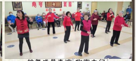
排舞成员表演「你家大门」