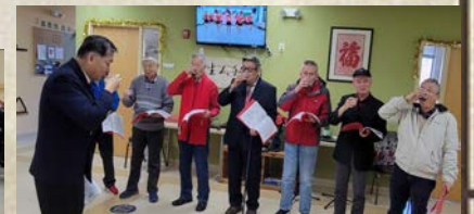
男声小组演唱「我们举杯」