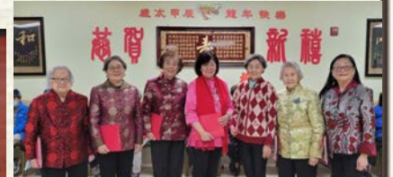
女声小组演唱「欢乐中国年」