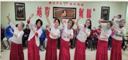
广场舞成员表演「你像三月桃花开」