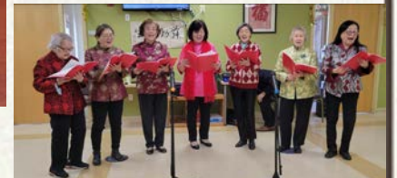
女声小组演唱「相逢是首歌」