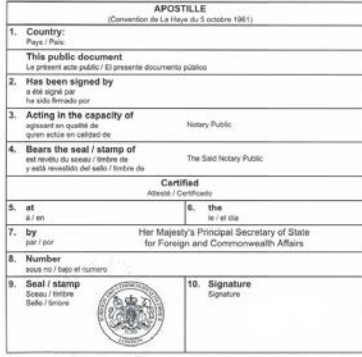
海牙认证样本文件