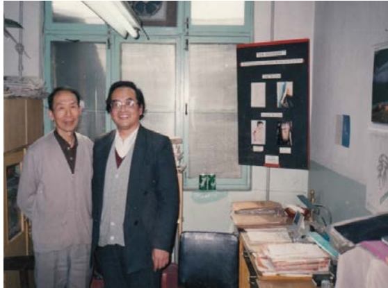
(作者与祝总骧教授合影)