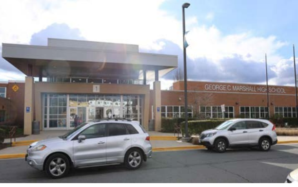
2024年1月7日春季学期开学第一天，学生们来到泰城校区所在的Marshall High School