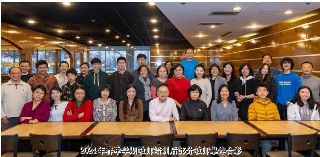
2024年春季学期教师培训后部分教师集体合影

泰城校区始终坚持希望中文学校“家长拥有，义工运作”的办学理念，用爱心为当地社区创造了一