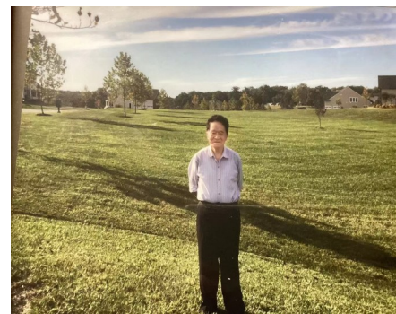
这是我女儿住房面前的绿草坪,大约有五十亩地大

在众多住房周边也有一块绿草坪,小的一、二亩,大的十多亩。绿茵茵的草地,再加上种有几株白里透红的樱花,红、白、绿色交相映辉,显得格外的美艳动人,格外使人陶醉,格外使人舒畅。