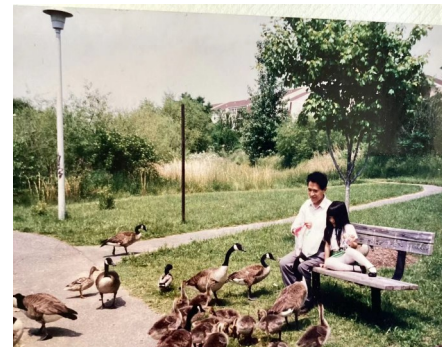
美国的野鸭、大雁根本不怕人

第二、野生动物保护好。我所见到的在美国华盛顿和纽约几十万平方公里土地上,有“四多”,即野鸭多、大雁多、野鹿多、松鼠多,并在水坑边和草地上随处可见。野鸭、大雁根本不怕人,像中国的家鸭、家鹅一个样,常走到你的脚边寻找食物。在中国的野鸭很远只要见到人影和一点响声,就惊恐地飞走了。大雁只是偶尔看见在空中成群集队的飞行,从没有近距离见过。并且野鸭在中国是候鸟,春去冬来,但在美国则是“常鸟”,环境改变了候鸟的特性。为什么能改变这个特性?候鸟变成了“常鸟”。这是因为美国人在大小水塘中修筑了一个岛,让它们在这里栖息“生儿育女”,因为野鸭、大雁都不在树上筑窝,都在草丛里生蛋,建一个岛,为它们提供一个“生儿育女”的安全环境和避险之地,不让其他野生动物伤害它们。