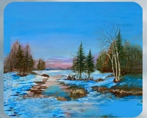
耆老书画作品之冬雪

进入冬季以来，时有恶劣天气，不适合耆老们进行户外活动，中心一部活动部及时调整了日常活动内容，增加了室内活动项目的比重，比如：益智游戏、手工劳作、棋牌类游戏等等，以丰富耆老们的日常生活，让大家可以安全、快乐、满足地渡过漫漫冬日。