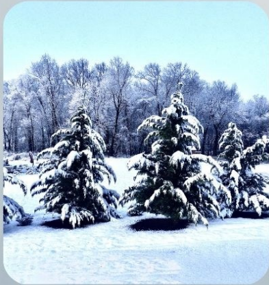
耆老摄影作品之冬雪