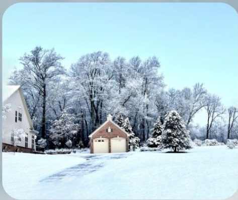
耆老摄影作品之冬雪