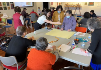
主讲人讲解暖身活动:情绪圆盘创作