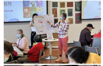
参与者分享该组创作理念