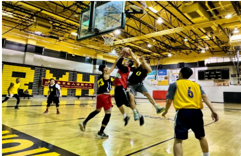
冠亚军赛激烈角逐