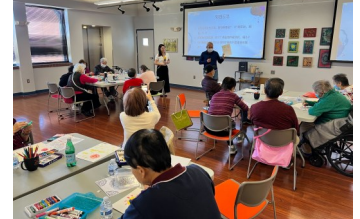
参与者分享“天空的情绪”个人创作及问题反思