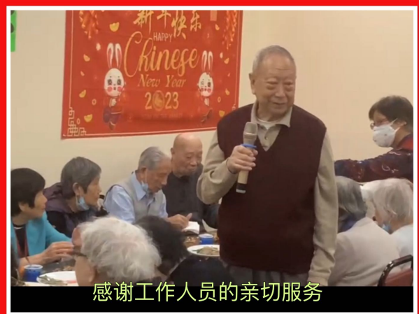
感谢工作人员的亲切服务