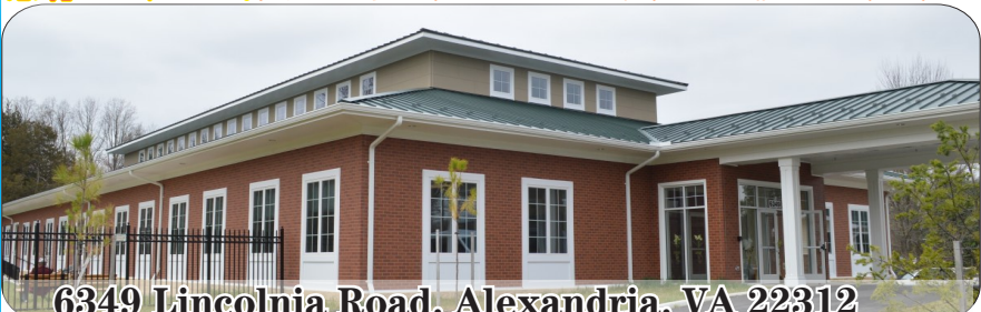
6349 Lincolnia Road, Alexandria, VA 22312