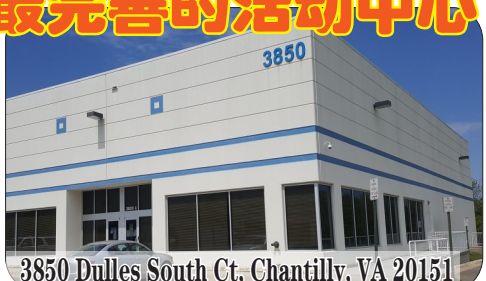
3850 Dulles South Ct, Chantilly, VA 20151