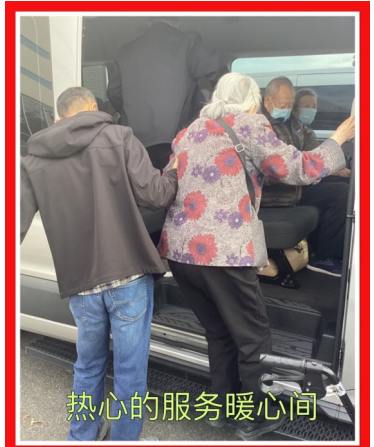
热心的服务暖心间

在这个感恩的日子里,我们不禁想起,爱心老人中心的一位年过九旬的卢教授曾经多次说过的话:我们十分感谢美国政府为我们提供了这么优越的医疗保健条件。是的,我们要永远满怀感恩之心,在爱心老人中心这个大家庭里健康快乐度过每一天!