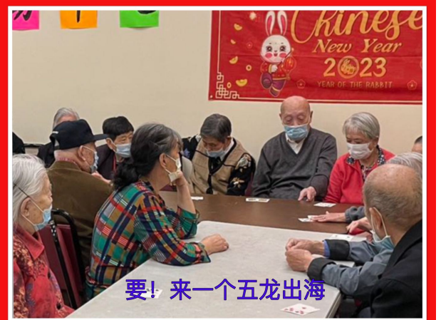
要! 来一个五龙出海