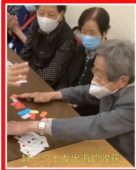
好一个七龙出海的收获