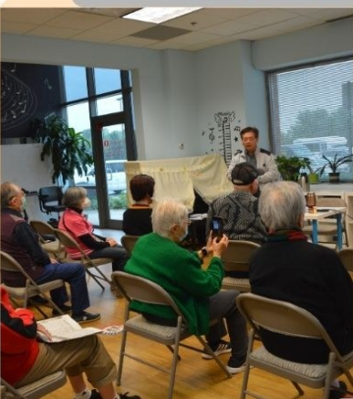
陈先生课后与耆老摄影留念