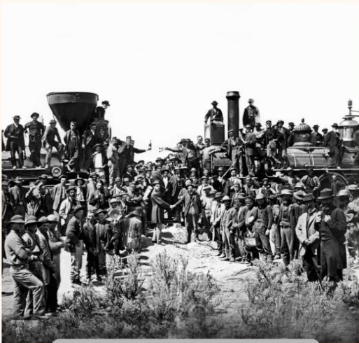
1869年铁路贯通时的留影