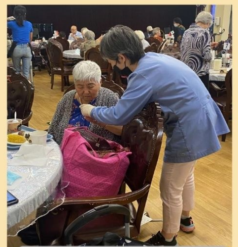
护理人员协助老人就餐