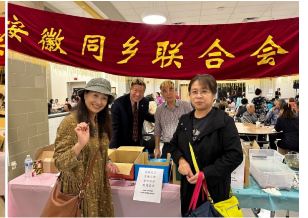
访客们品尝洽洽瓜子

2023年9月23日晚,虽然秋雨淅淅沥沥,但华府地区的中秋晚会暨小吃庙会依然洋溢着浪漫和诗意。由大华府地区同乡会联合会主办的庆中秋活动如期举行,为大华府地区的华人华侨及其它族裔的人们带来了难得的团聚时光。