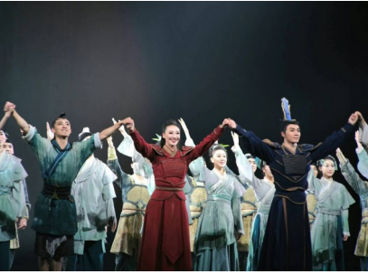
演出结束时的谢幕