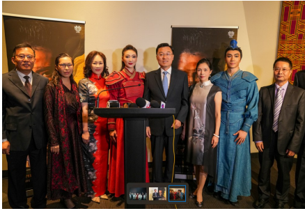
中国驻美大使谢锋与主办单位领导以及舞剧主演合影