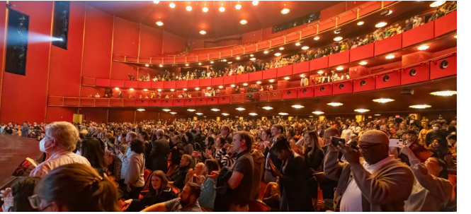
观众在演出结束时长时间站立鼓掌