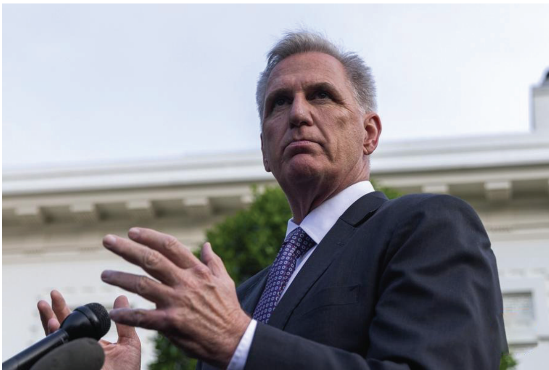
美国国会众议院议长、共和党人麦卡锡9月12日对媒体说，他已要求众议院相关委员会对拜登启动正式弹劾调查。这是麦卡锡在美国华盛顿白宫回答记者提问的资料照片(5月22日摄)。