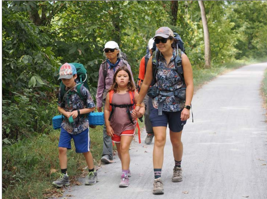
夏日燃脂战不仅对参与者有益,也刺激了当地商业的增长。比赛需要参与者购买运动装备、餐饮和其他与健康生活方式相关的产品和服务。这为当地经济带来了积极影响,同时也提高了小商家的业务。更令人鼓舞的是,许多地方商家积极响应了这项倡