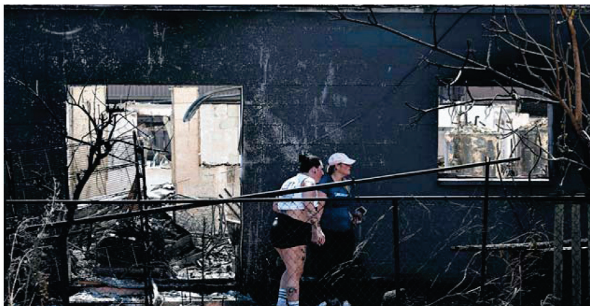
11日,在夏威夷州毛伊岛拉海纳,人们走过被野火烧毁的房屋。

美国夏威夷州毛伊岛百年“最致命”野火截至当地时间14日已造成99人死亡。州长格林预计,还将发现更多遇难者遗体,最终死亡人数可能达到目前确认人数的两倍。